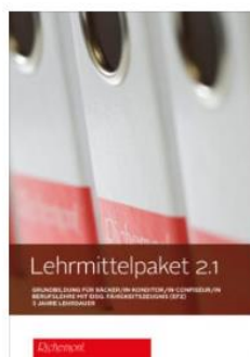
Lehrmittelpaket 2.1 (EFZ, Fachrichtung Bäckerei-Konditorei)