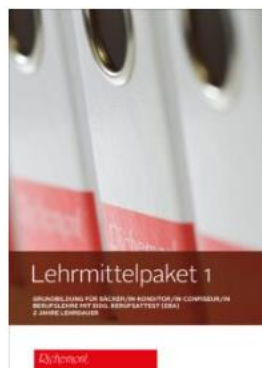
Lehrmittelpaket 1 (EBA)

Auf „ LEHRMITTELPAKET “ klicken und passendes Lehrmittelpaket suchen.